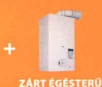
ZÁRT ÉGÉSTERŐ FALIKAZÁN