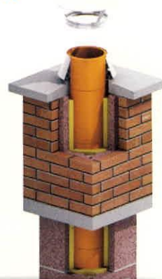
FALAZOTT KÉMÉNYFEJ GYÁRI FEDLAPPAL