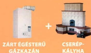
ZÁRT ÉGÉSTERŐ GÁZKAZÁN